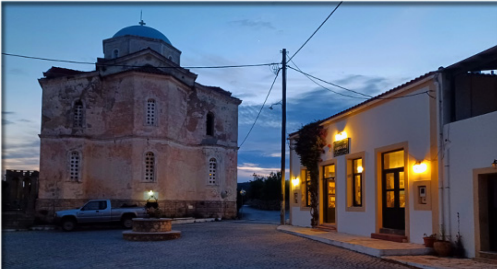
Die "Blaue Stunde" findet auch in Kythira statt