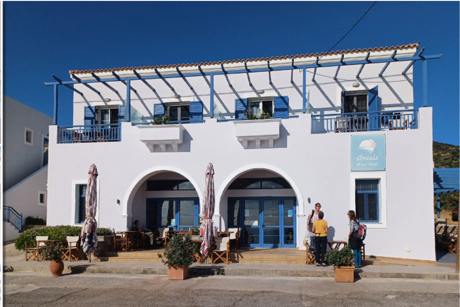
Hotel Anesis, Ag.Pelagia, Kythira