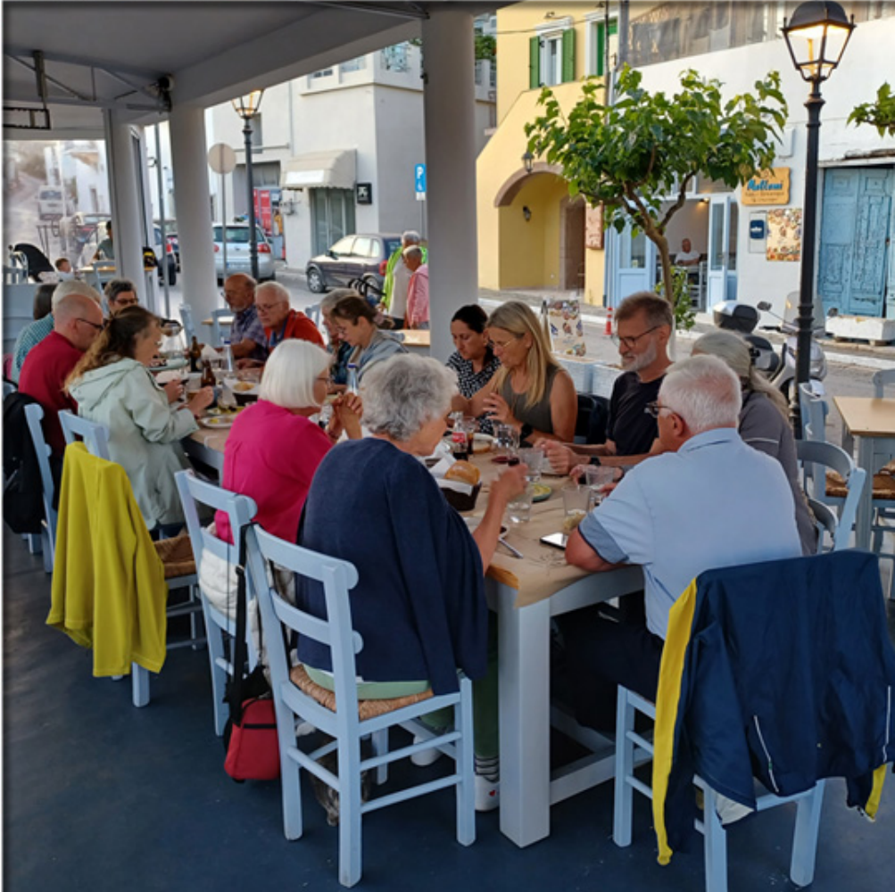
Verköstigung nach der Wanderung