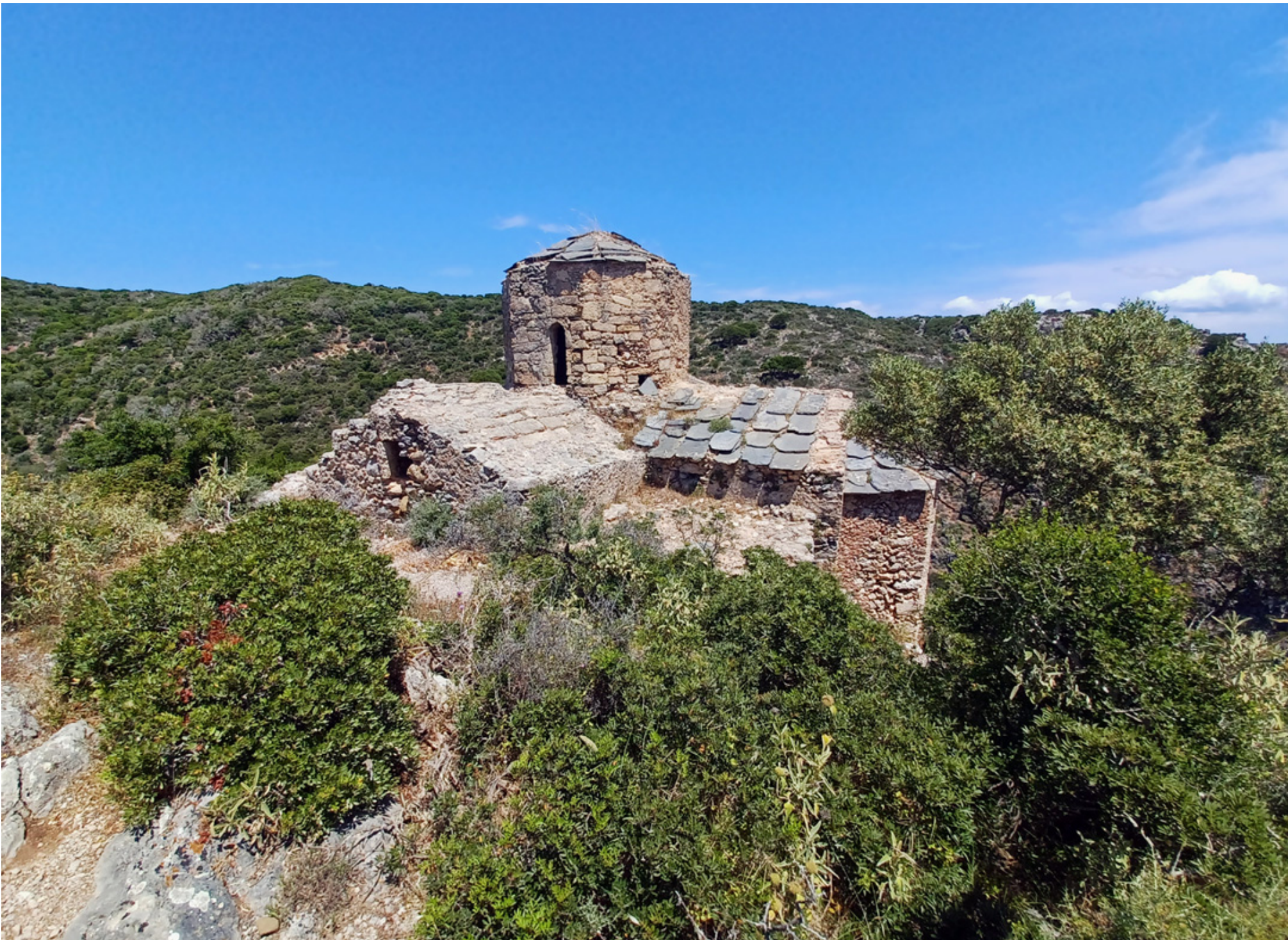
Ayia Vavara, alte Kirche in struppiger Umgebung