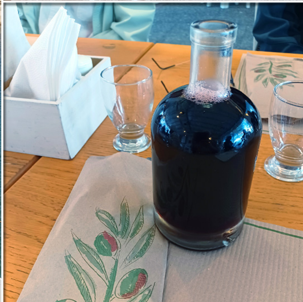
"Greek Salad" und offener Rotwein