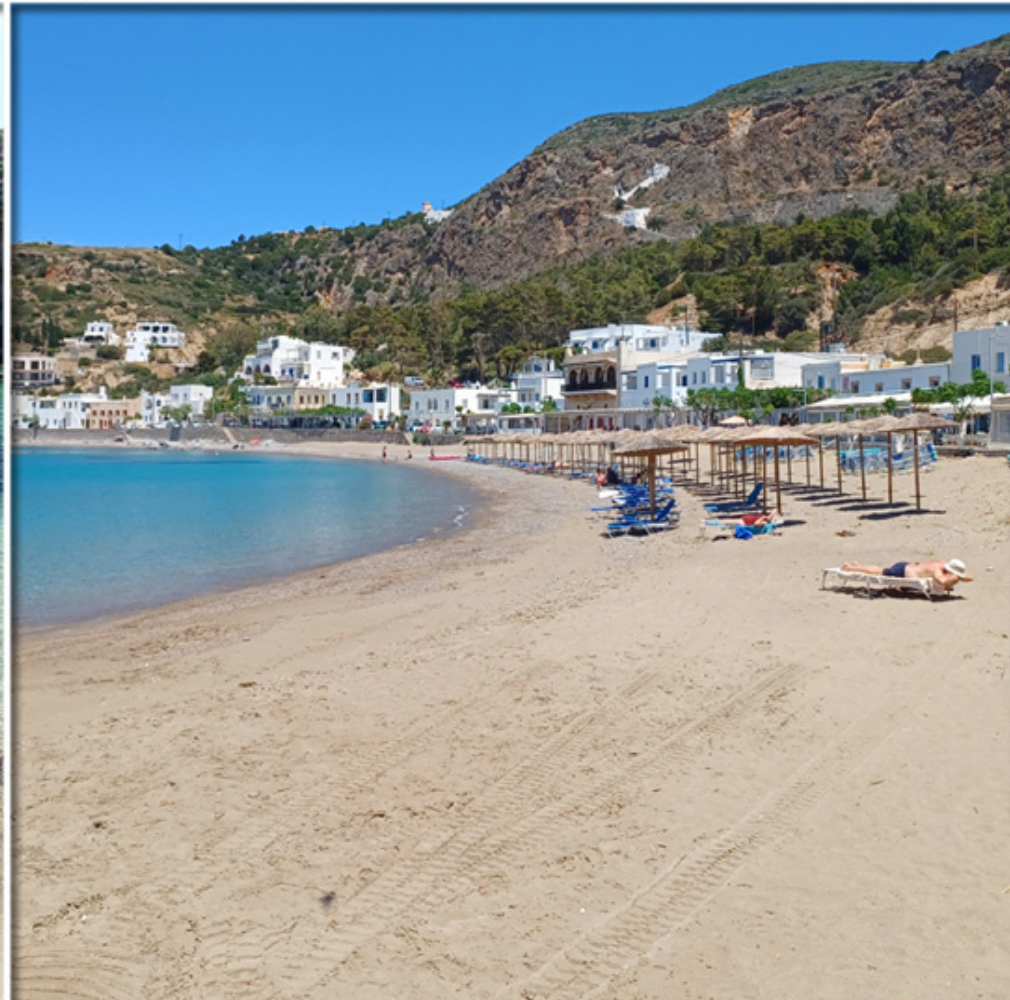
Unterschiedliche Strände, vom Feinsten!