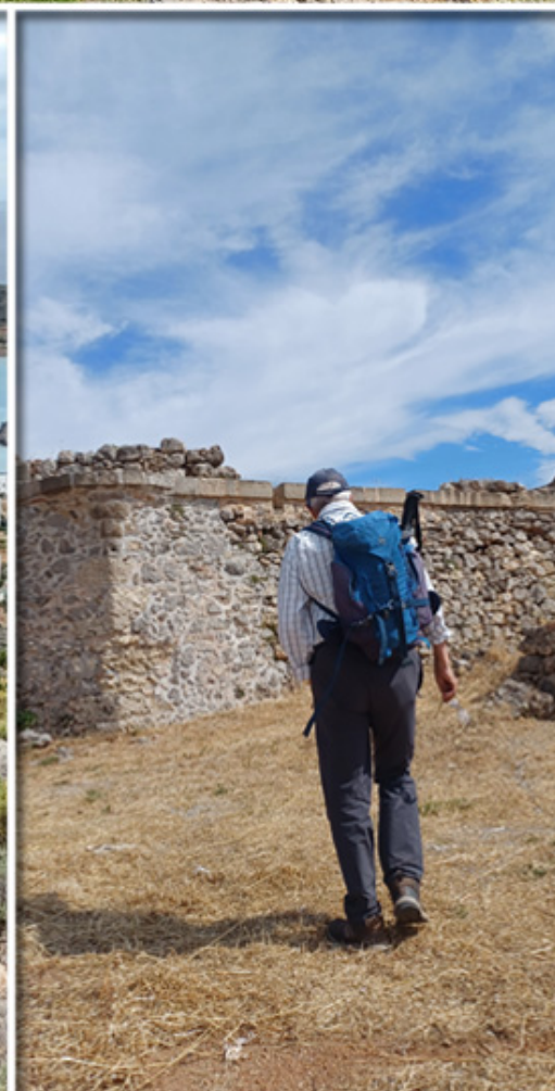
Die laufstarke Imbach-Wandergruppe