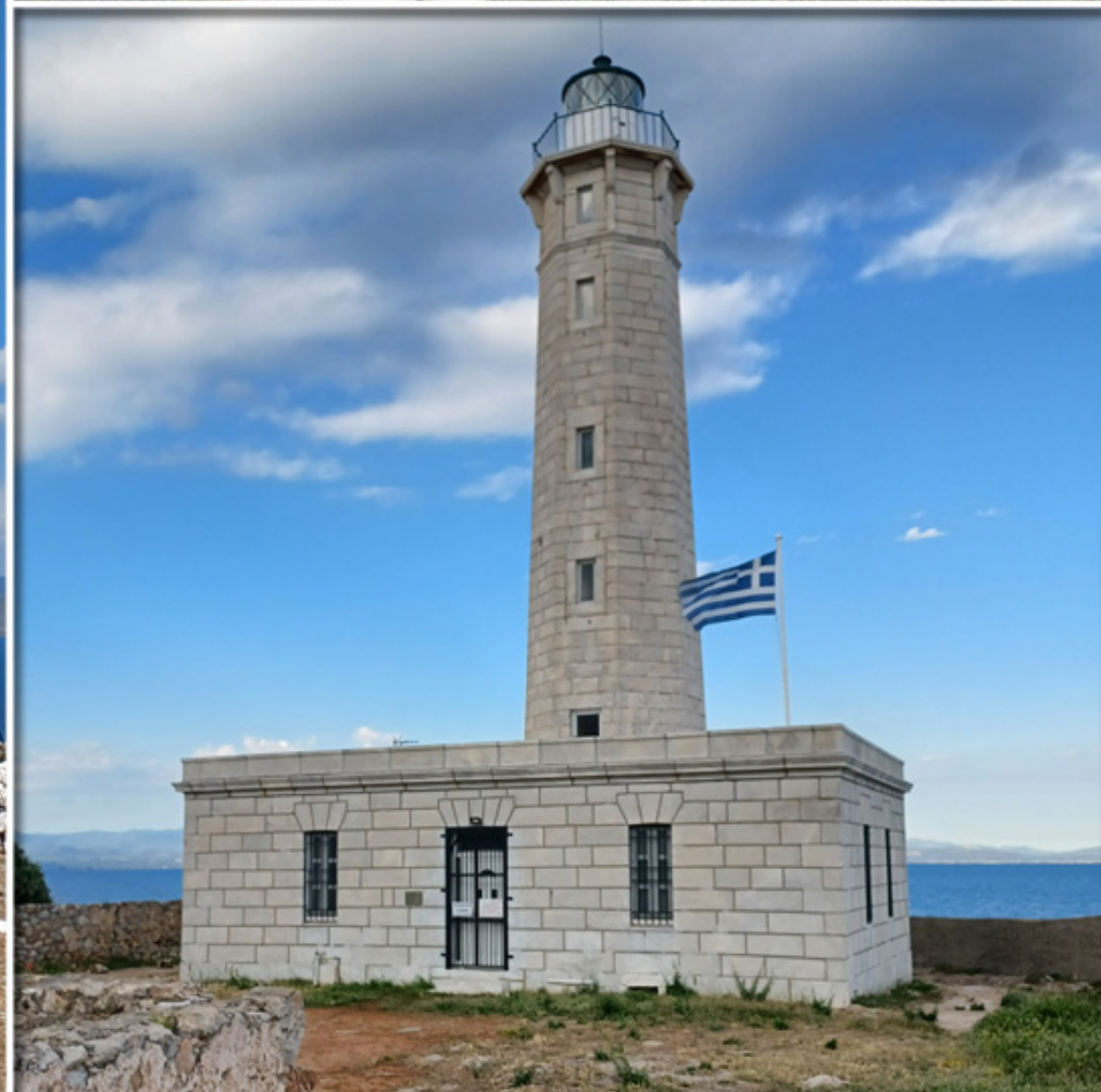
Leuchttürme, alt aber gut erhalten