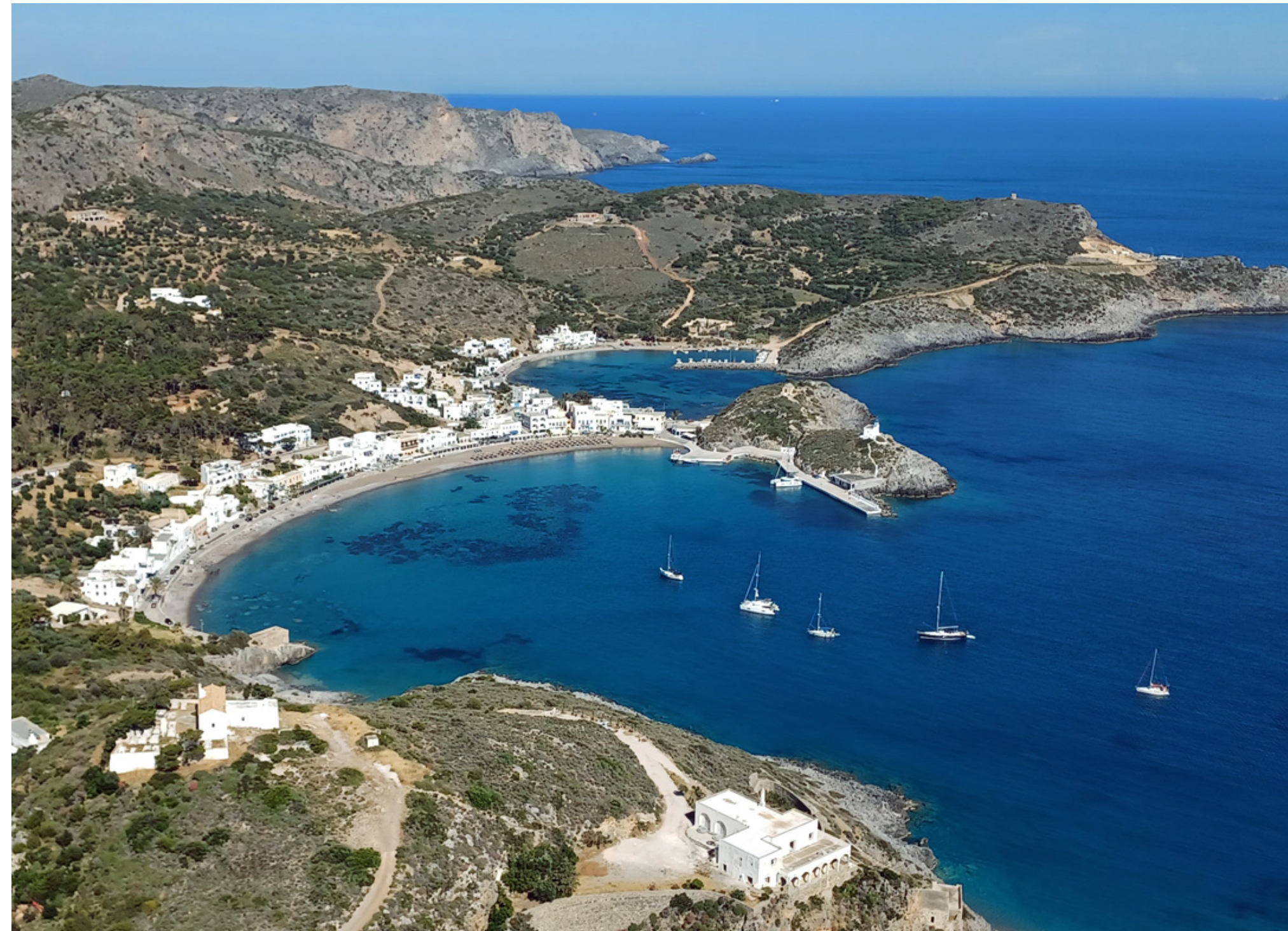
Bucht von Kapsali

"Der Geheimtipp der Griechen" - Mai 2026