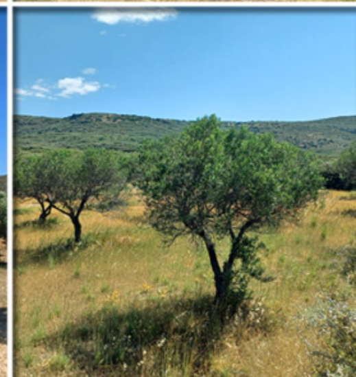
Auf der Suche nach dem perfekten Olivenbaum