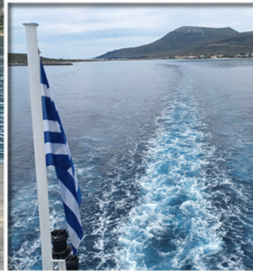
Fähren nach/von Kythira